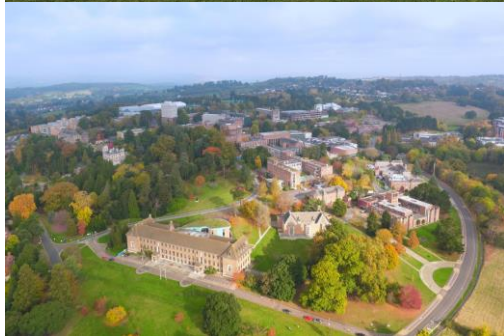
UNIVERSITY OF EXETER