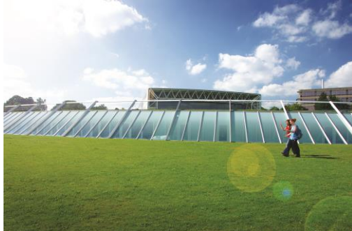
UNIVERSITY OF EAST ANGLIA